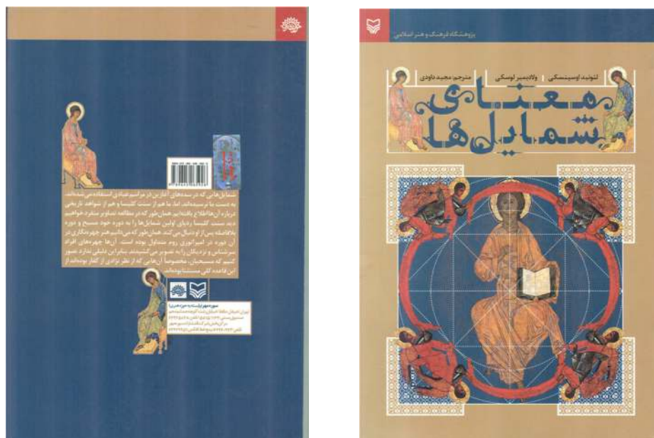
شکل ۲. طرح جلد ترجمه